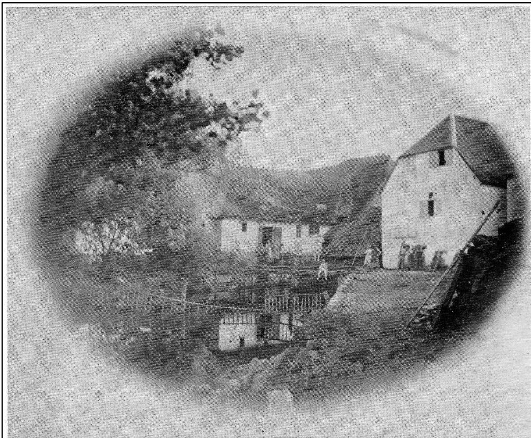
Holløse mølle. Ubekendt fotograf. Foto i privat eje. Billedet er øjensynligt taget fra »mølleøen« lige neden for goldslusen, så vi ser indløbet til møllehjulene under det lave, skrå tag. Der er lavet spærring med tremmer for at stoppe grene og lignende, der kunne komme drivende med vandet. Huset til højre må være selve møllebygningen med kværnene. Til venstre en fløj af beboelseshuset. jfr. Philip Smidths situationsplan.

Udateret billede af Holløse Mølle (herunder) er lån fra bogen 'Susåen og Den Danneskjoldske Kanal', side 61 (af J. Ingemann Pedersen, 1986).