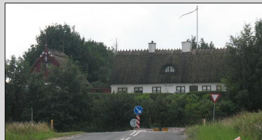
Ny Næstvedvej 55 (foto 2009)