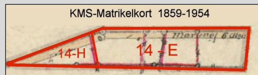
Matr.nr. 14-e og 14-h Senere sammenlagt til matr.nr. 14-e

Som nævnt har der ligget 6 huse på matr.nr. 14-e.