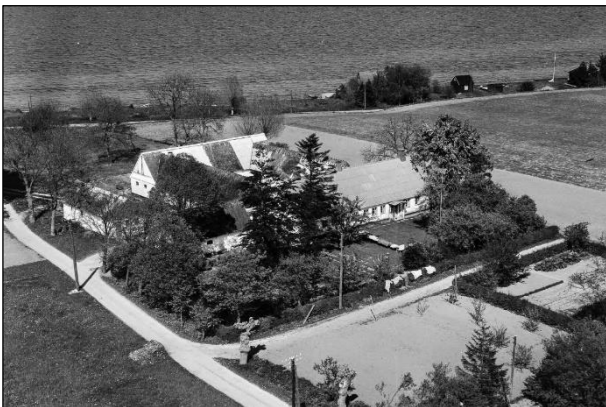
Lendrumgaard - Luffoto 1955