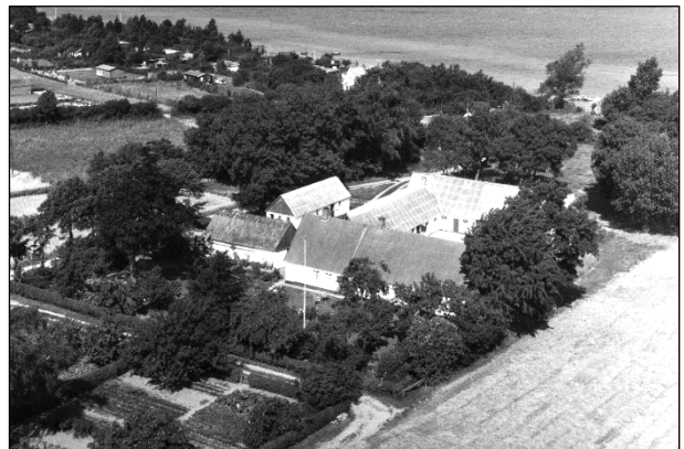
Lendrumgaard - Luffoto 1964