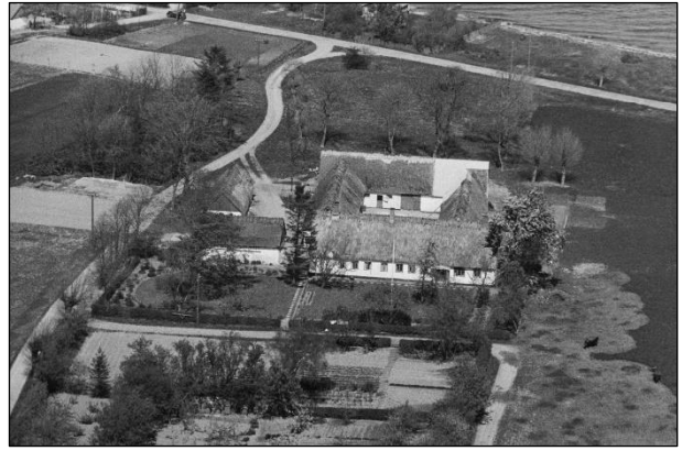
Lendrumgaard - Luffoto 1949