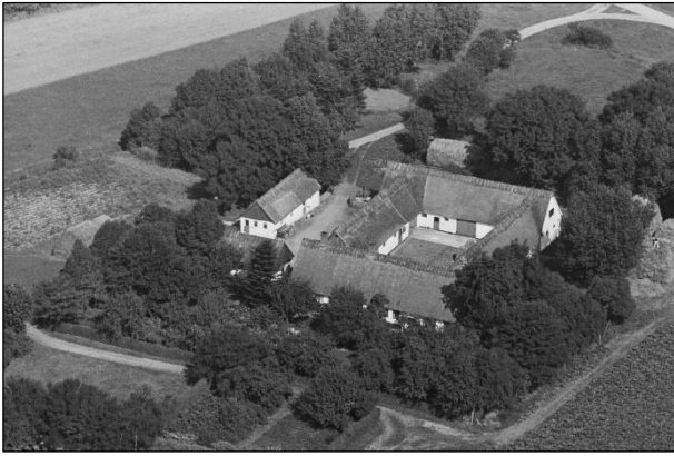
Lendrumgaard - Luffoto 1937

Luffotos fra 'Danmark set fra Luften' (Det Kongelige Bibliotek):