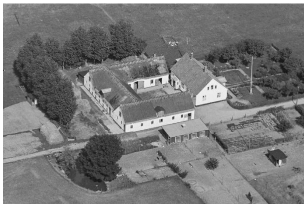
Ny Lysgaard - Luffoto 1937