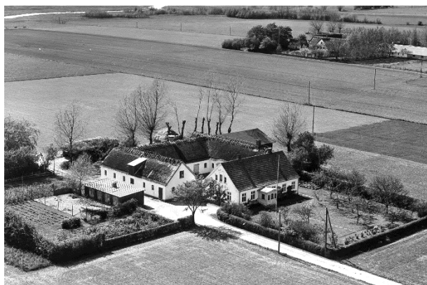
Ny Lysgaard - Luffoto 1955