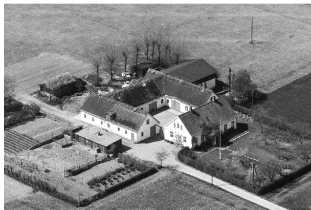
Ny Lysgaard - Luffoto 1949