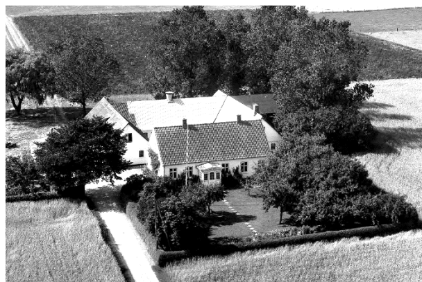
Ny Lysgaard - Luffoto 1964