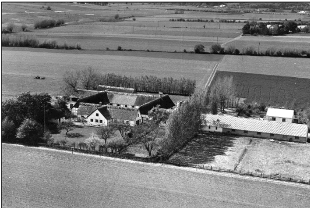
Gl. Lysgaard - Luffoto 1955