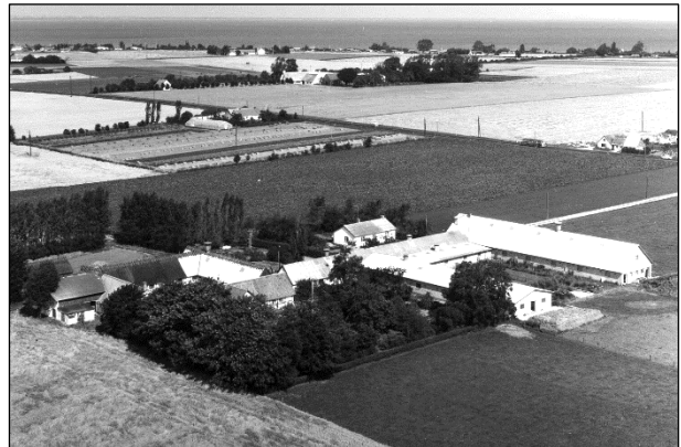
Gl. Lysgaard - Luffoto 1964