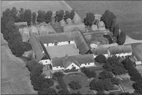
Gl. Lysgaard - Luffoto 1937

Luffotos fra 'Danmark set fra Luften' (Det Kongelige Bibliotek):