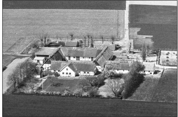
Gl. Lysgaard - Luffoto 1949