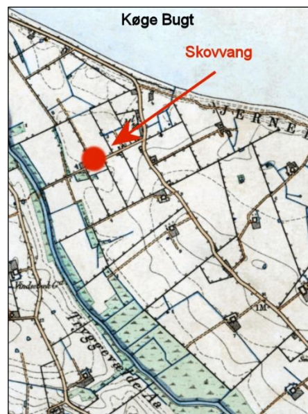
Kortudsnit - Ca. 1840

Gårdens stuehus fra 1868 eksisterer stadig (2019) på adressen Aastrædet 16B, 4600 Køge.