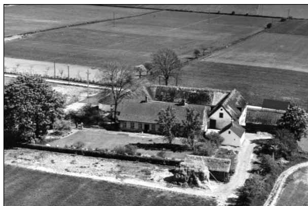
Skovvang - Luffoto 1955