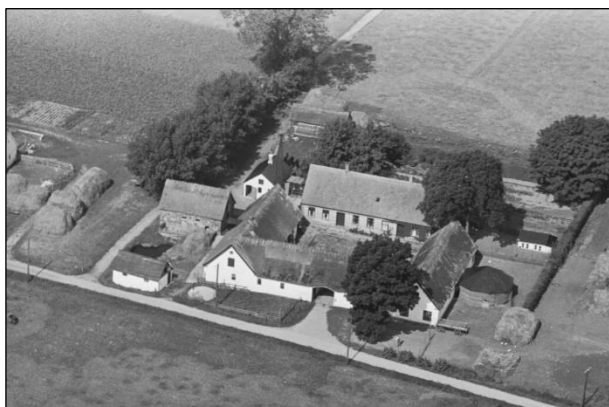
Skovvang - Luffoto 1937