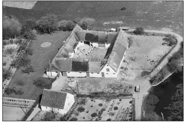
Kærgaard - Luffoto 1949