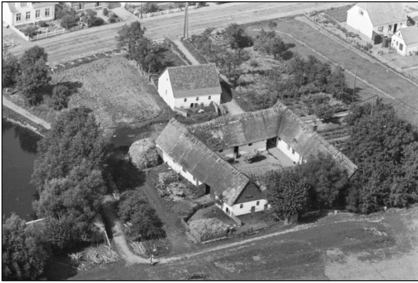
Kærgaard - Luffoto 1937

Luffotos fra 'Danmark set fra Luften' (Det Kongelige Bibliotek):