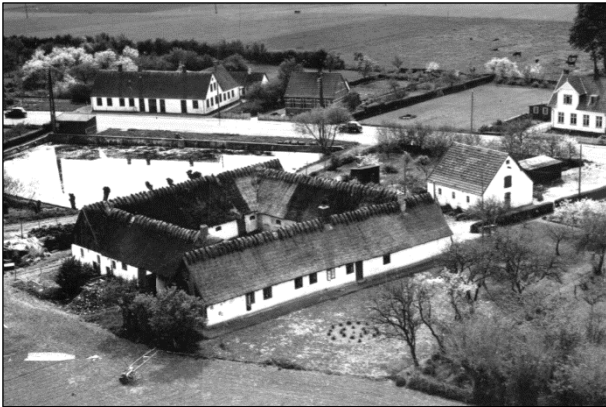
Kærgaard - Luffoto 1952