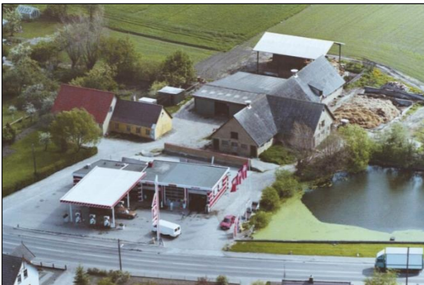
Kærgaard - Luffoto 1987