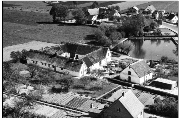
Kærgaard - Luffoto 1955