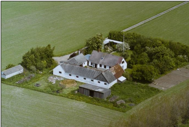
Møllebækgaard - Luftfoto 1987