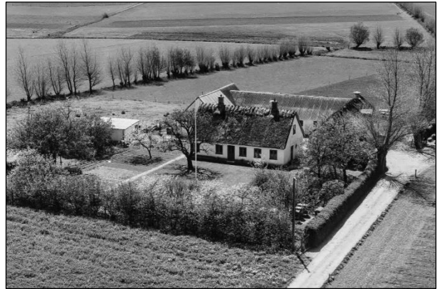
Møllebækgaard - Luftfoto 1955