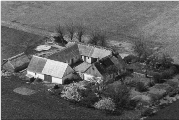
Møllebækgaard - Luftfoto 1949

Luffotos fra 'Danmark set fra Luften' (Det Kongelige Bibliotek):