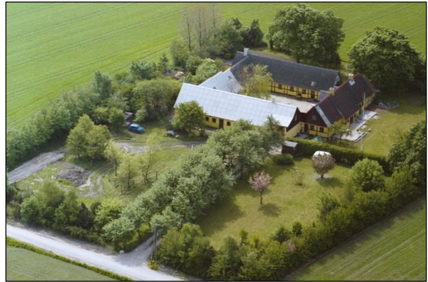
Damgaard - Luftfoto 1987