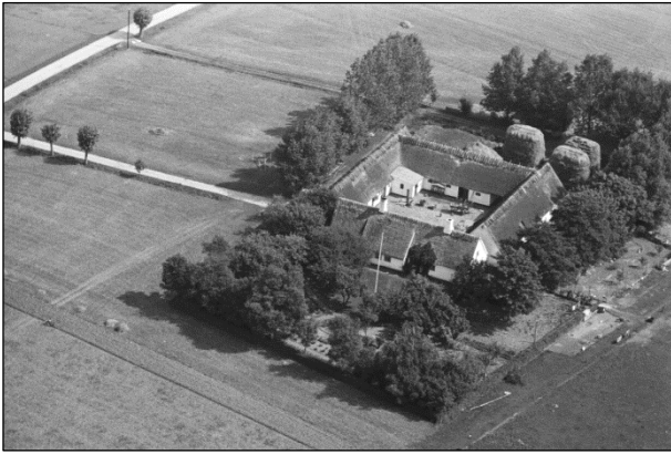
Damgaard - Luftfoto 1937