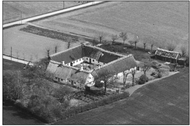
Damgaard - Luftfoto 1949