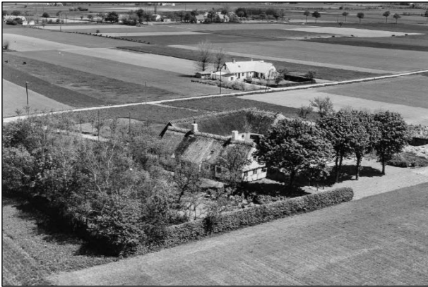
Damgaard - Luftfoto 1955