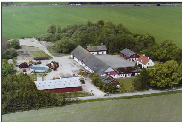
Aulebjerg - Luftfoto 1987