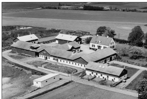
Aulebjerg - Luftfoto 1955