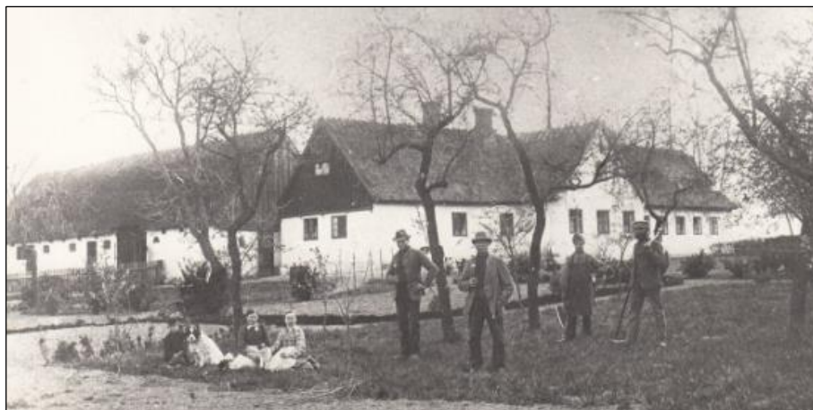
Foto af Aulebjerggaard fra Vallø Lokalarkiv Datering 1920-30 (dvs. før branden i 1932)