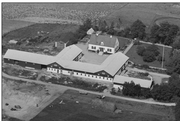
Aulebjerg - Luftfoto 1937

Luffotos fra 'Danmark set fra Luften' (Det Kongelige Bibliotek):