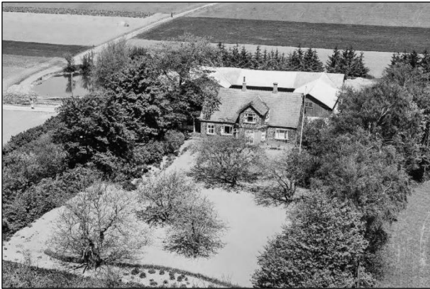
Skelgaard - Luffoto 1955