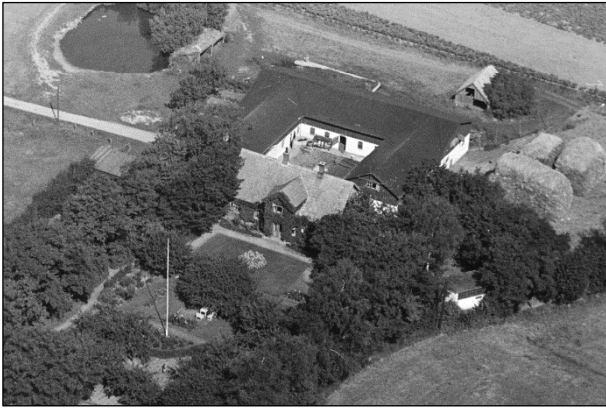
Skelgaard - Luffoto 1937

Luffotos fra 'Danmark set fra Luften' (Det Kongelige Bibliotek):