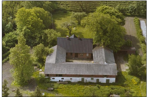
Skelgaard - Luffoto 1987