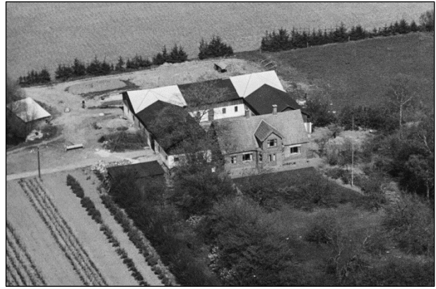
Skelgaard - Luffoto 1949