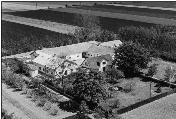
Amagergaarden - Luftfoto 1955