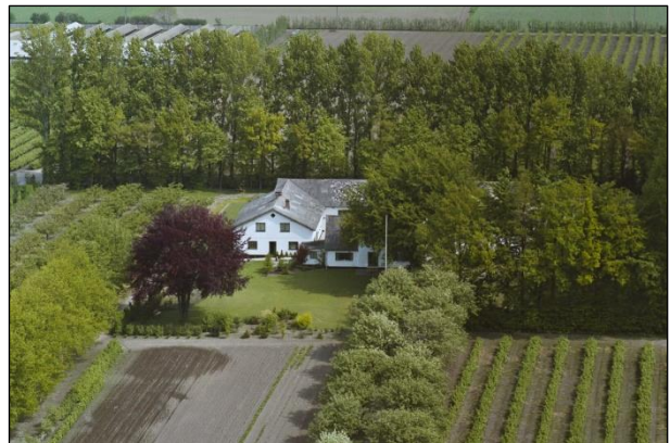
Amagergaarden - Luftfoto 1987