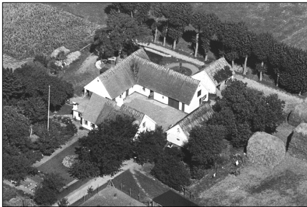
Amagergaarden - Luftfoto 1937

Luftfotos fra 'Danmark set fra Luften' (Det Kongelige Bibliotek):