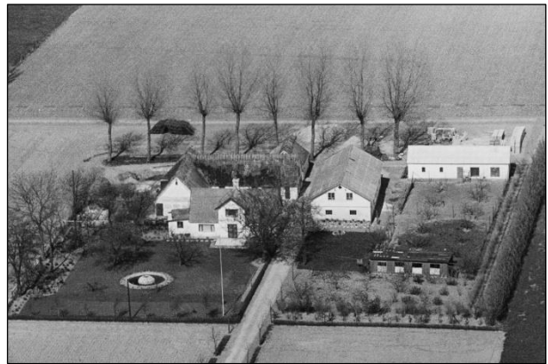
Amagergaarden - Luftfoto 1949