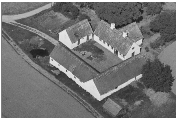
Højagergaard - Luffoto 1937

Luffotos fra 'Danmark set fra Luften' (Det Kongelige Bibliotek):