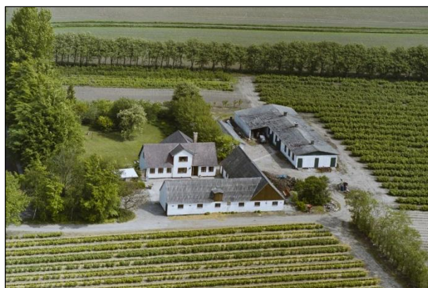
Højagergaard - Luffoto 1987