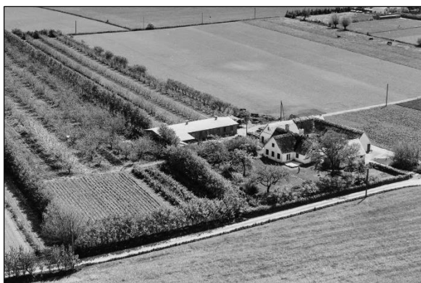
Højagergaard - Luffoto 1955