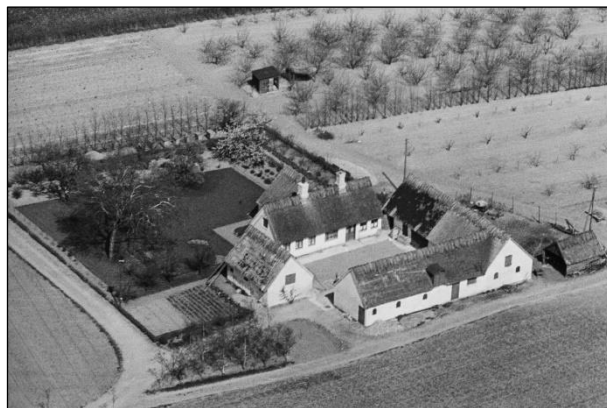
Højagergaard - Luffoto 1949