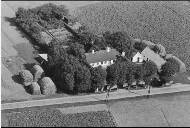
Maglebyvej 3 - Luftfoto 1937