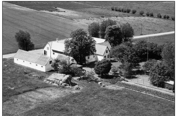
Maglebyvej 3 - Luftfoto 1955