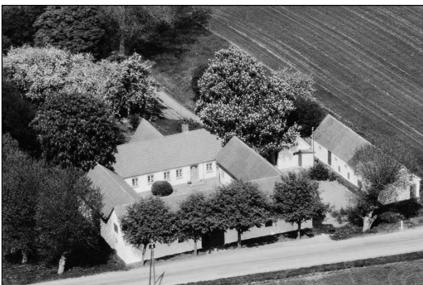
Maglebyvej 3 - Luftfoto 1979