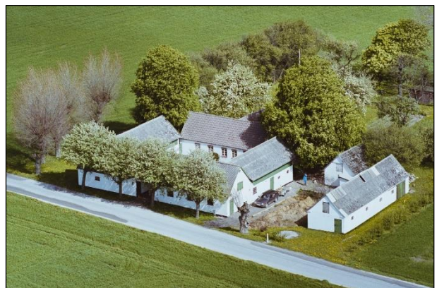
Maglebyvej 3 - Luftfoto 1987