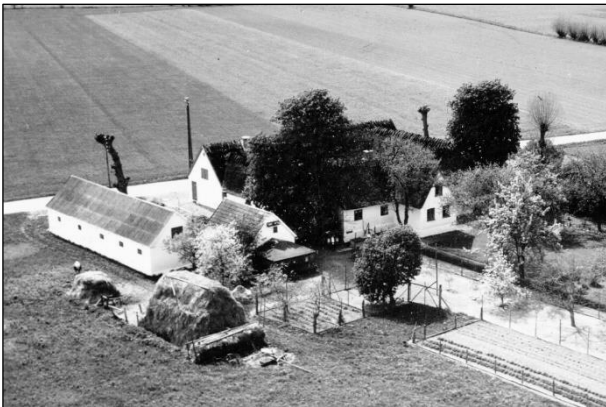
Maglebyvej 3 - Luftfoto 1952