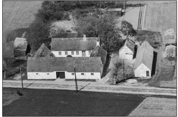
Maglebyvej 3 - Luftfoto 1949