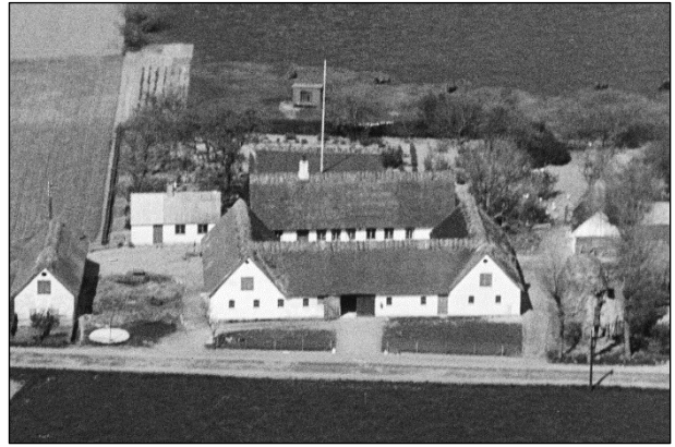
Maglebæk - Luffoto 1949