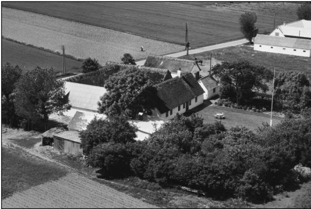
Maglebæk - Luffoto 1955