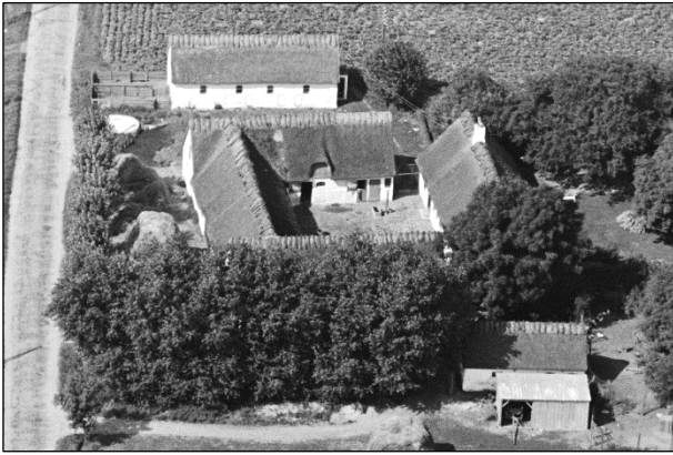
Maglebæk - Luffoto 1937