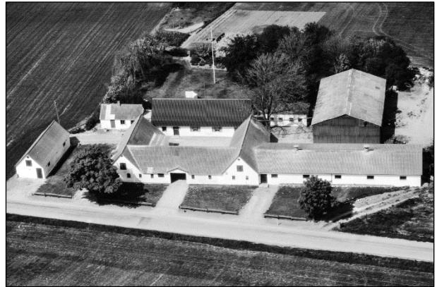
Maglebæk - Luffoto 1979