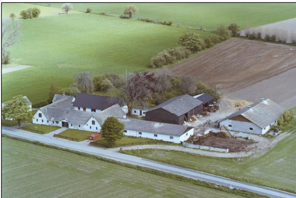
Maglebæk - Luffoto 1987