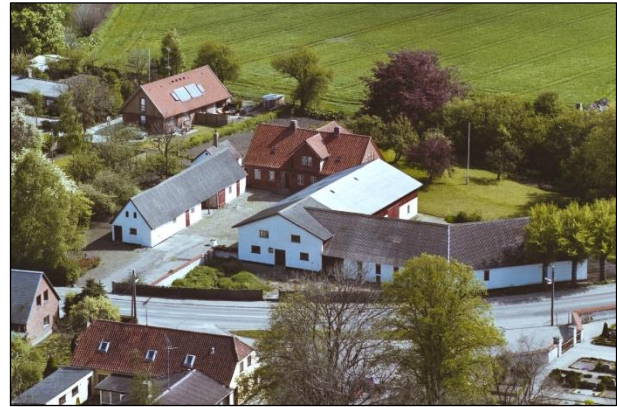
Stølgaard - Luffoto 1987