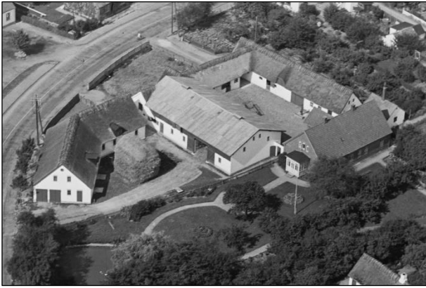
Stølgaard - Luffoto 1937

Luffotos fra 'Danmark set fra Luften' (Det Kongelige Bibliotek):