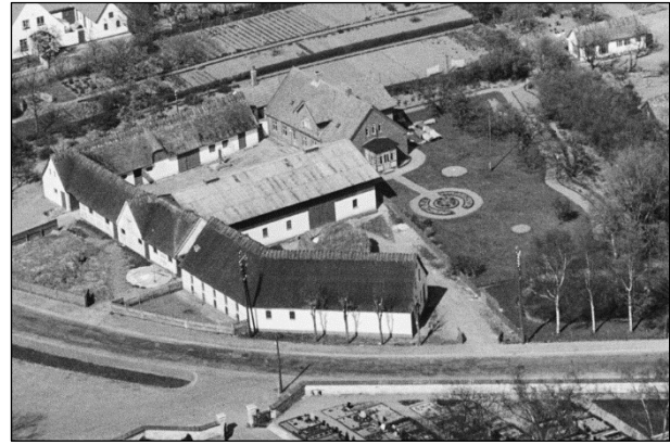
Stølgaard - Luffoto 1949