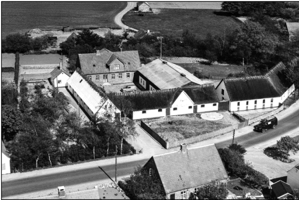
Stølgaard - Luffoto 1955