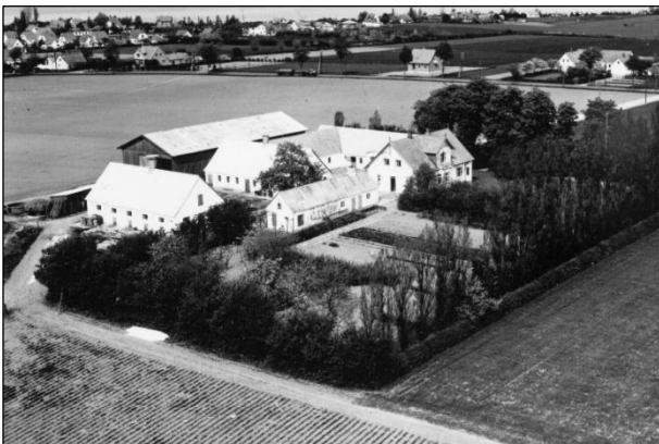
Bakkegaard - Luffoto 1952