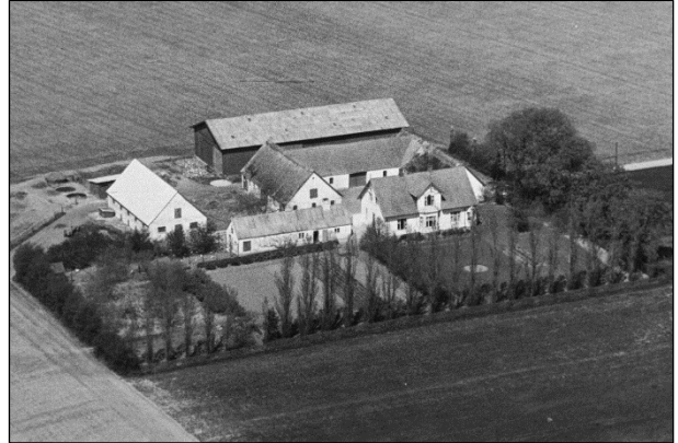
Bakkegaard - Luffoto 1949