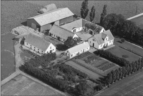
Bakkegaard - Luffoto 1937

Luffotos fra 'Danmark set fra Luften' (Det Kongelige Bibliotek):