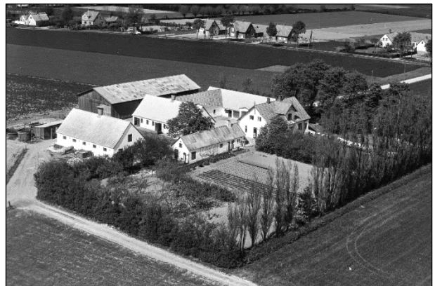
Bakkegaard - Luffoto 1955