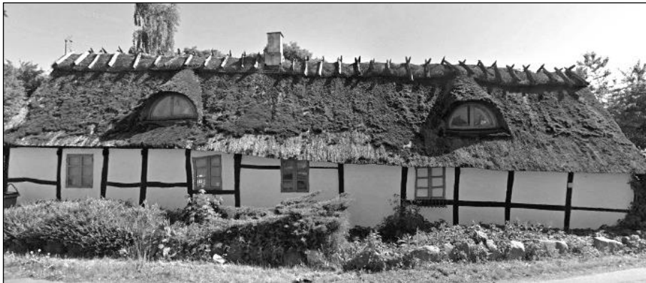
Muligvis gammelt stuehus i byen (?) Adresse: Strandvejen 6, Strøby - Matr.nr. 4-c, Strøby (Google Earth 2009)