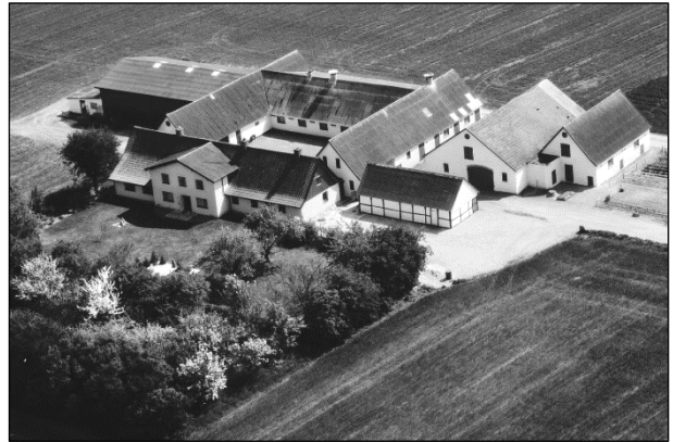
Spangkærvej 3 - Luffoto 1979