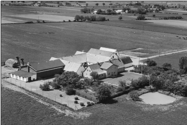
Spangkærvej 3 - Luffoto 1955