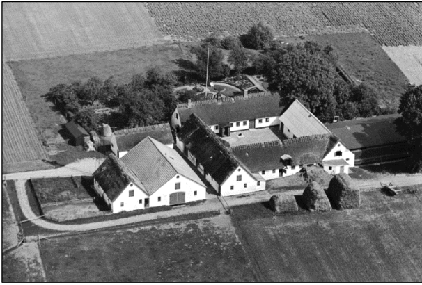
Spangkærvej 3 - Luffoto 1937

Luffotos fra 'Danmark set fra Luften' (Det Kongelige Bibliotek):