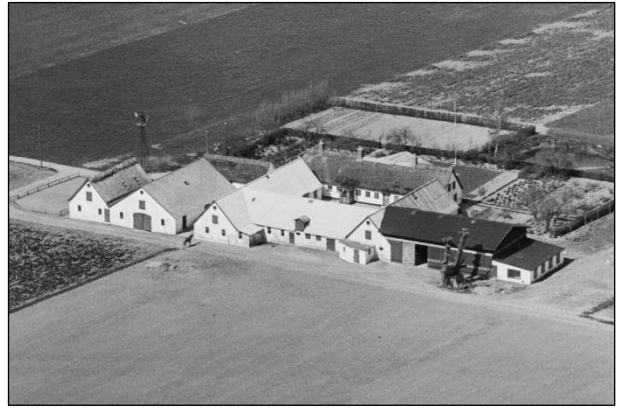
Spangkærvej 3 - Luffoto 1949