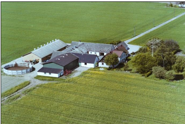
Spangkærvej 3 - Luffoto 1987