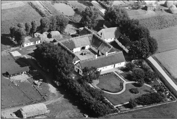
Østergaard - Luffoto 1937 Den gamle gård på matr.nr. 36-a

Luffotos fra 'Danmark set fra Luften' (Det Kongelige Bibliotek):