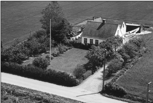
Østergaard - Luffoto 1955 Ejendommen beliggende på matr.nr. 36-d