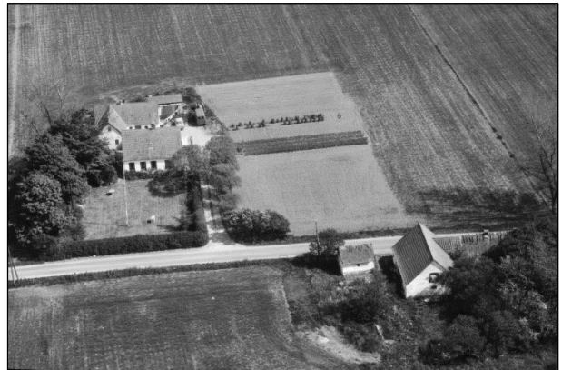
Østergaard - Luffoto 1979 Ejendommen beliggende på matr.nr. 36-d