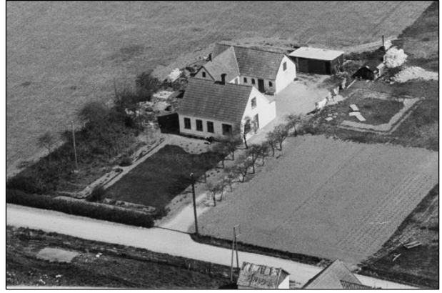
Østergaard - Luffoto 1949 Ejendommen beliggende på matr.nr. 36-d