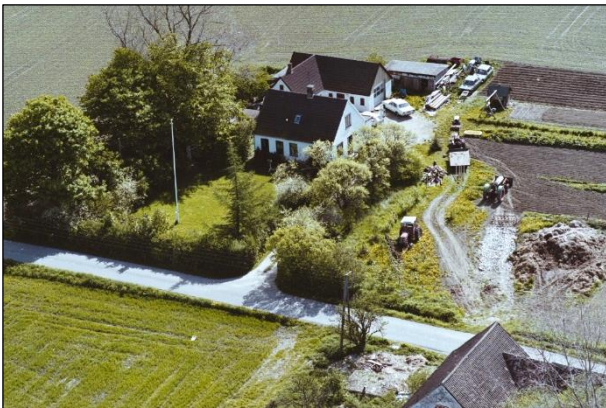
Østergaard - Luffoto 1987 Ejendommen beliggende på matr.nr. 36-d