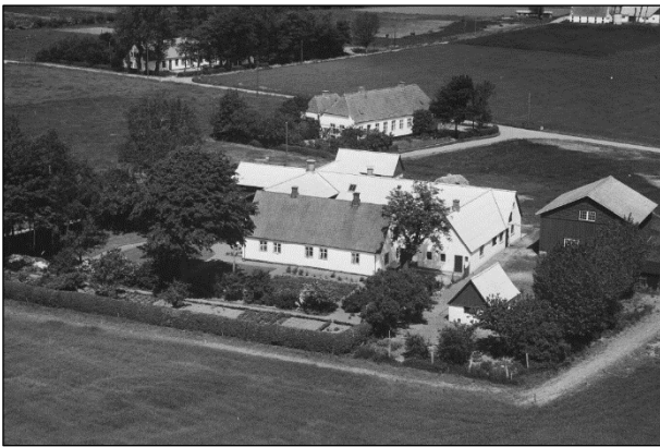
Toftegaard - Luftfoto 1955