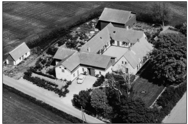
Toftegaard - Luftfoto 1979