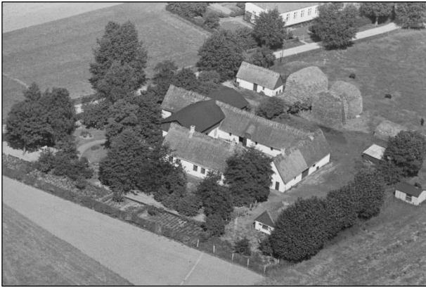
Toftegaard - Luftfoto 1939

Luftfotos fra 'Danmark set fra Luften' (Det Kongelige Bibliotek):