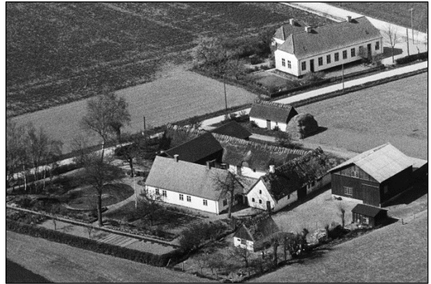
Toftegaard - Luftfoto 1949