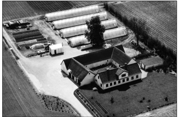
Toftehøj - Luffoto 1979