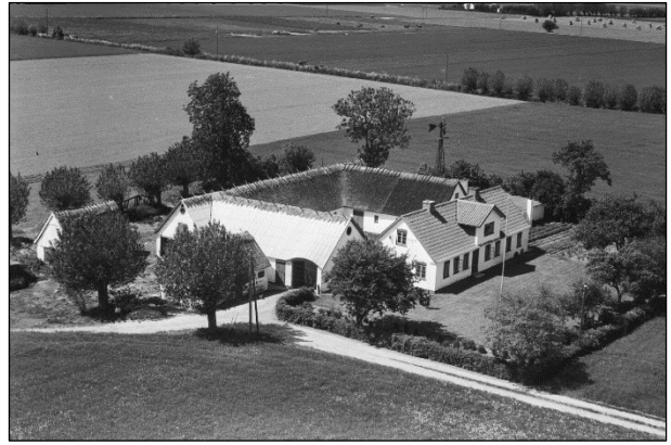
Toftehøj - Luffoto 1955