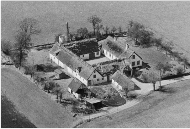
Toftehøj - Luffoto 1949

Luffotos fra 'Danmark set fra Luften' (Det Kongelige Bibliotek):