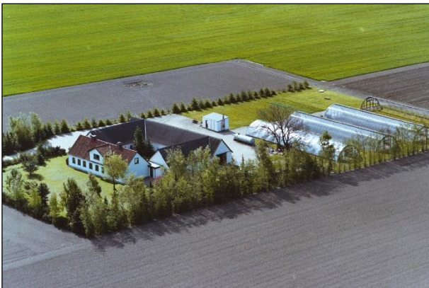
Toftehøj - Luffoto 1987