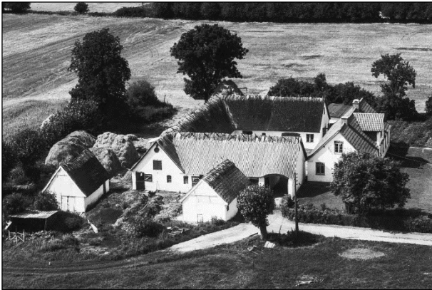
Toftehøj - Luffoto 1961