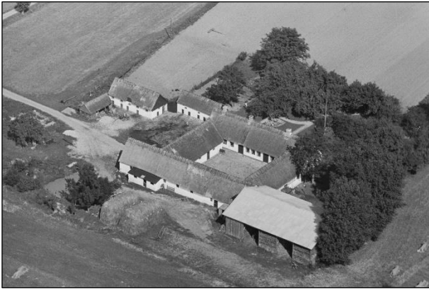
Pilehavegaard - Luffoto 1937

Luffotos fra 'Danmark set fra Luften' (Det Kongelige Bibliotek):