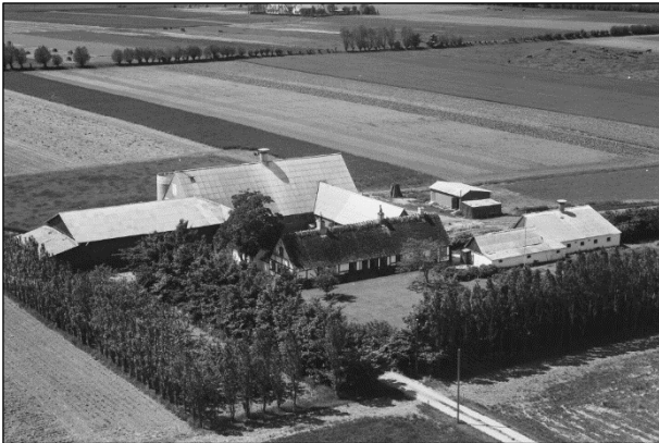
Pilehavegaard - Luffoto 1955