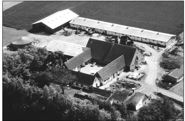
Pilehavegaard - Luffoto 1979