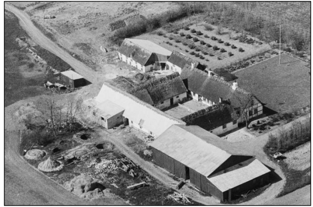
Pilehavegaard - Luffoto 1949