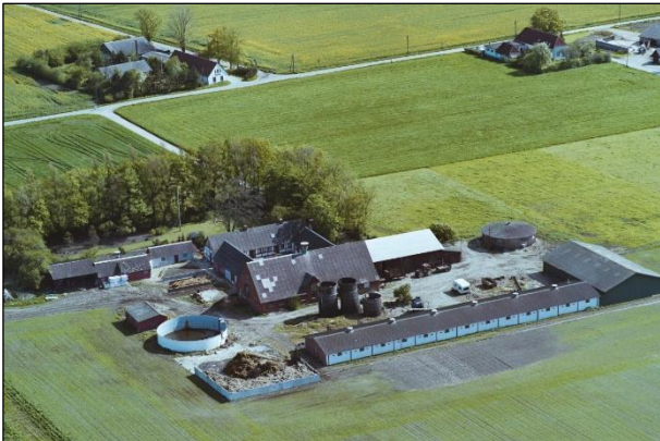
Pilehavegaard - Luffoto 1987