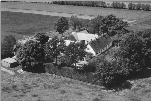
Matr.nr. 33-b - Luffoto 1955