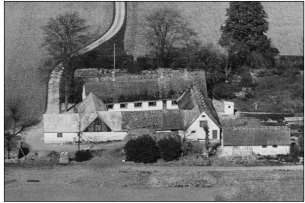
Matr.nr. 33-b - Luffoto 1949