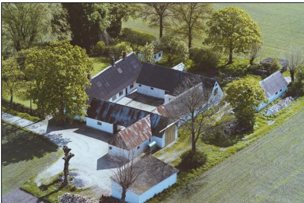
Matr.nr. 33-b - Luffoto 1987