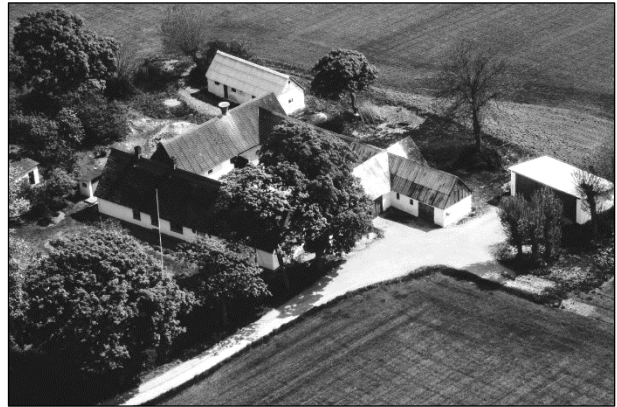
Matr.nr. 33-b - Luffoto 1979