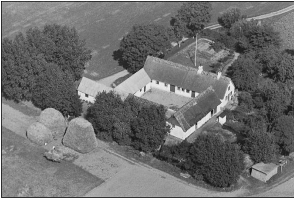
Matr.nr. 33-b - Luffoto 1937

Luffotos fra 'Danmark set fra Luften' (Det Kongelige Bibliotek):