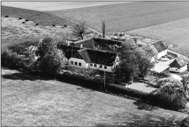
Ellekær - Luftfoto 1955