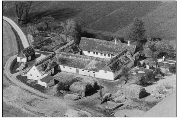
Ellekær - Luftfoto 1949