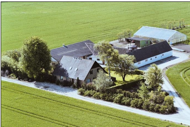
Ellekær - Luftfoto 1987