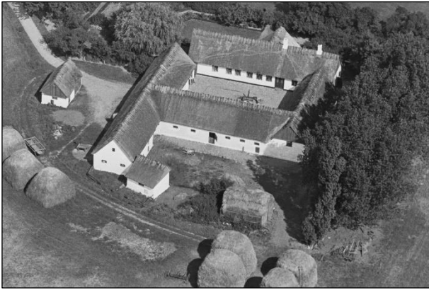
Ellekær - Luftfoto 1937

Luffotos fra 'Danmark set fra Luften' (Det Kongelige Bibliotek):