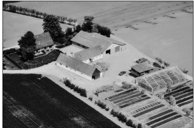
Ellekær - Luftfoto 1979