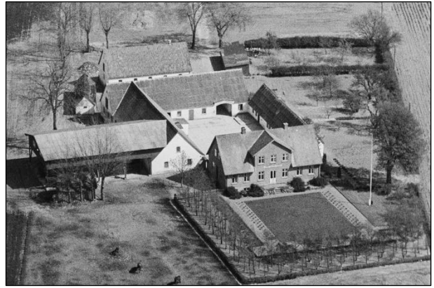
Grøfteledsgaard - Luffoto 1949