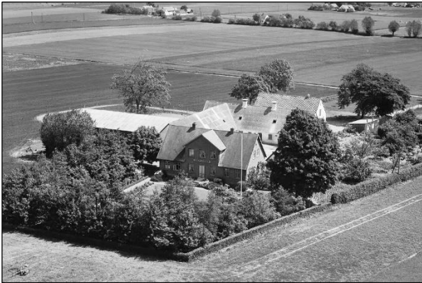
Grøfteledsgaard - Luffoto 1955