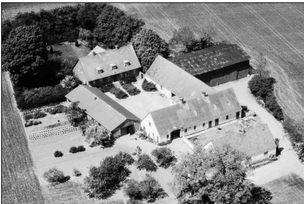
Grøfteledsgaard - Luffoto 1979