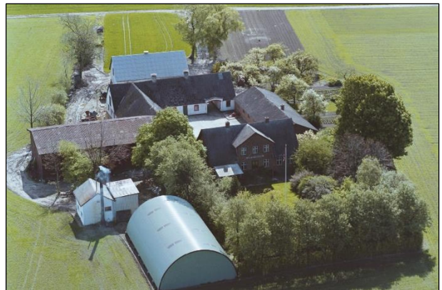
Grøfteledsgaard - Luffoto 1987