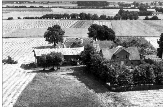
Grøfteledsgaard - Luffoto 1961