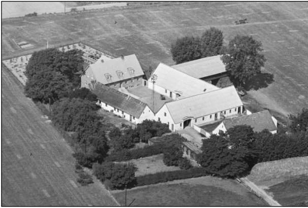
Grøfteledsgaard - Luffoto 1937

Luffotos fra 'Danmark set fra Luften' (Det Kongelige Bibliotek):