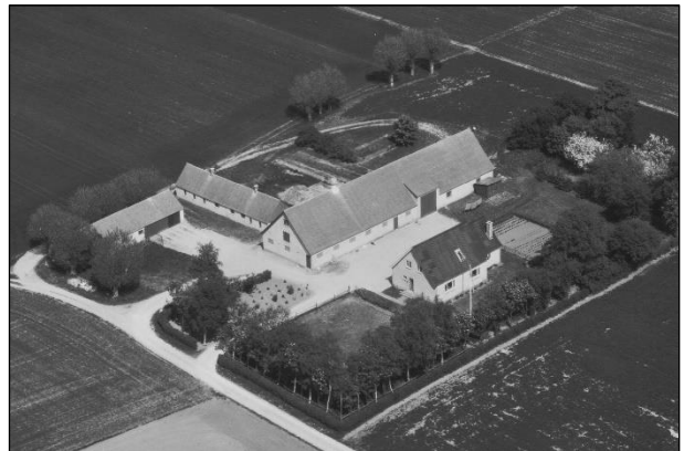
Grøftehøj - Luffoto 1979