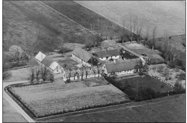
Grøftehøj - Luffoto 1949