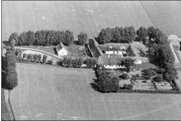
Grøftehøj - Luffoto 1937

Luffotos fra 'Danmark set fra Luften' (Det Kongelige Bibliotek):