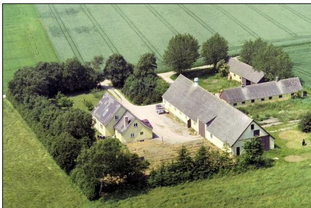
Grøftehøj - Luffoto 1987