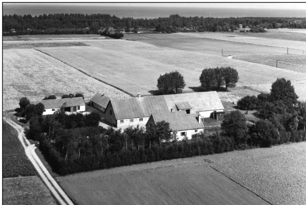
Grøftehøj - Luffoto 1964