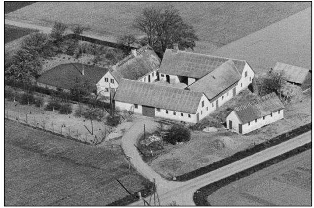
Dalgaard - Luffoto 1949