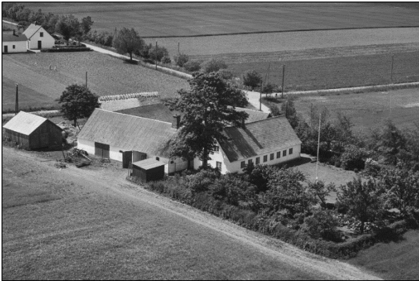
Dalgaard - Luffoto 1955