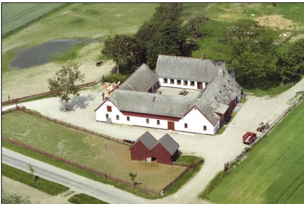
Dalgaard - Luffoto 1987