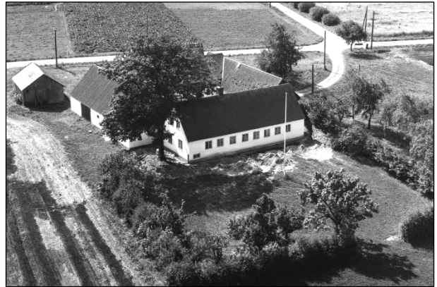
Dalgaard - Luffoto 1964