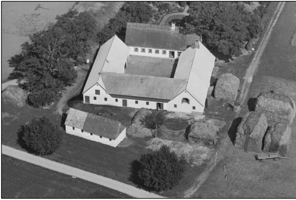
Dalgaard - Luffoto 1937

Luffotos fra 'Danmark set fra Luften' (Det Kongelige Bibliotek):