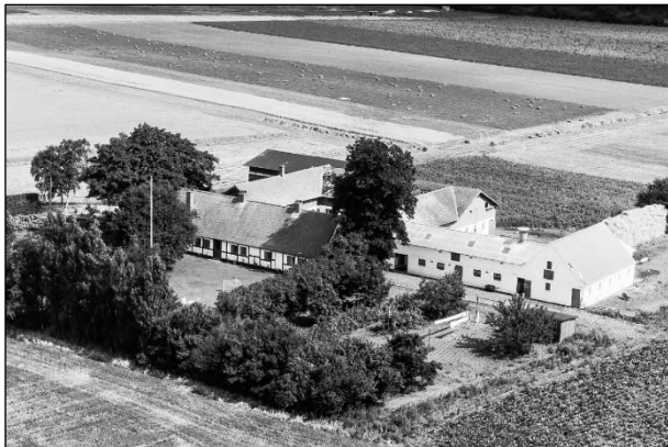
Garderhøj - Luffoto 1961