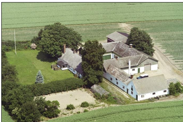
Garderhøj - Luffoto 1987