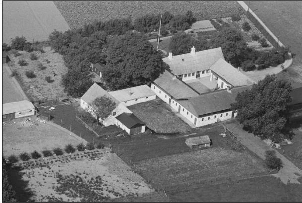
Garderhøj - Luffoto 1939

Luffotos fra 'Danmark set fra Luften' (Det Kongelige Bibliotek):