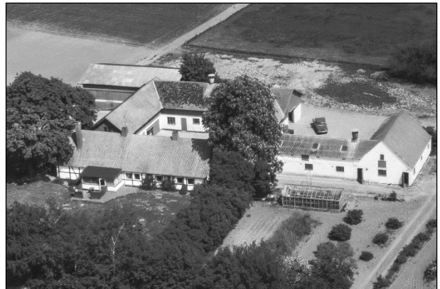
Garderhøj - Luffoto 1979