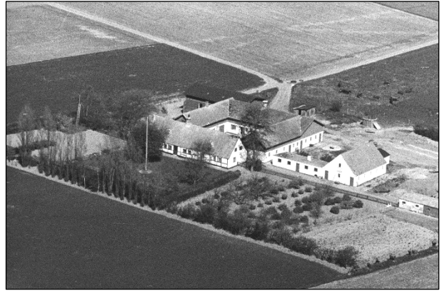
Garderhøj - Luffoto 1949