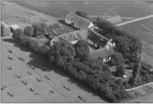
Tammosegaard - Luftfoto 1937

Luffotos fra 'Danmark set fra Luften' (Det Kongelige Bibliotek):