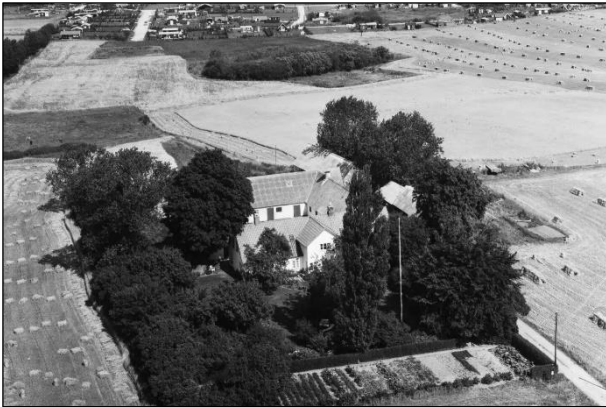
Tammosegaard - Luftfoto 1964