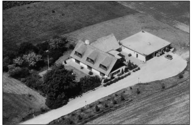
Tammosegaard - Luftfoto 1979