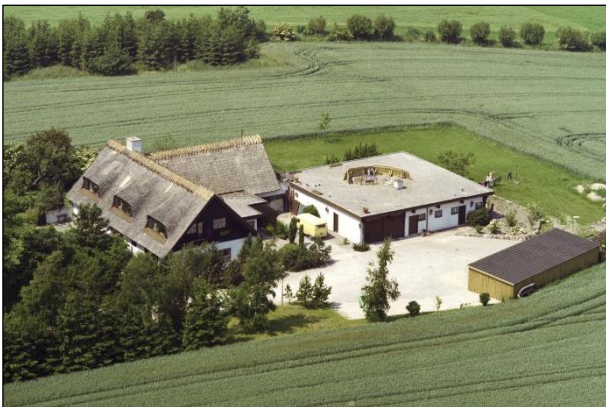
Tammosegaard - Luftfoto 1987