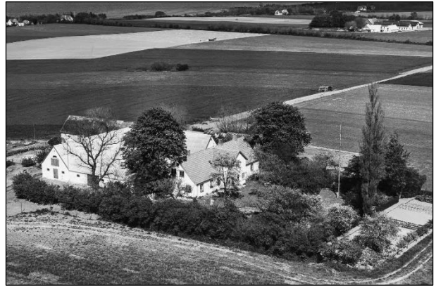
Tammosegaard - Luftfoto 1955