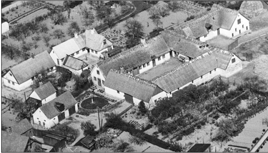
Toftevang - Luffoto 1949

Luffoto fra 'Danmark set fra Luften' (Det Kongelige Bibliotek):