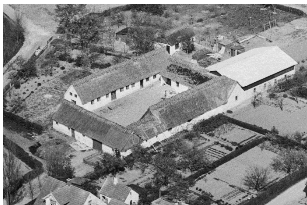
Sarpegaard - Luffoto 1949

Luffotos fra 'Danmark set fra Luften' (Det Kongelige Bibliotek):