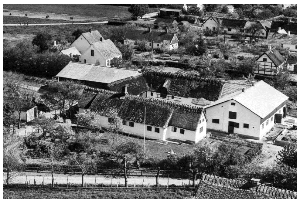
Sarpegaard - Luffoto 1955