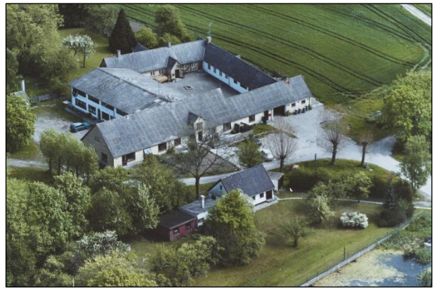
Laigaard - Luftfoto 1987