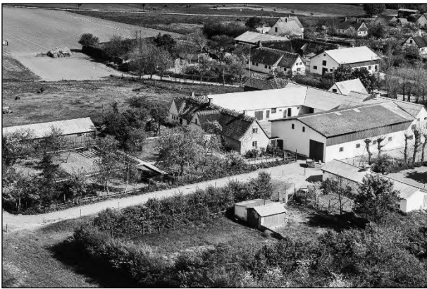
Laigaard - Luftfoto 1955