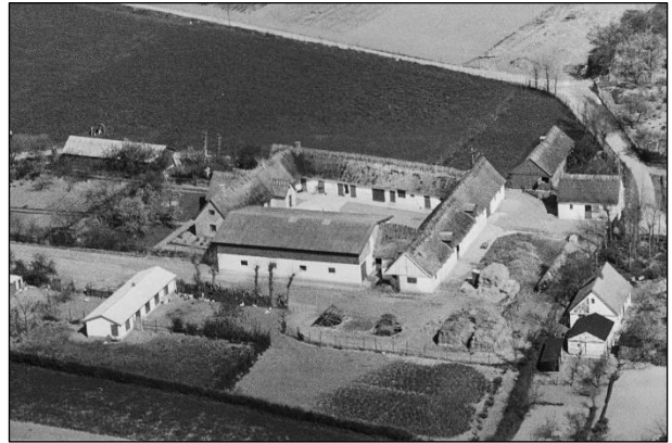
Laigaard - Luftfoto 1949