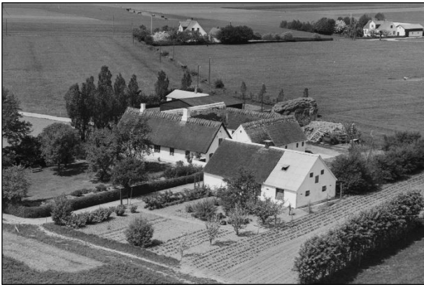
Løndal - Luffoto 1954