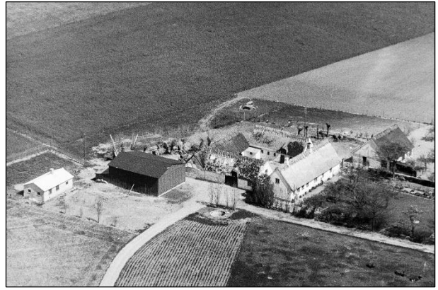
Løndal - Luffoto 1949