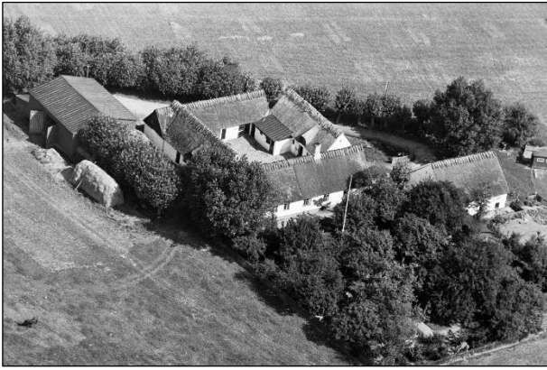
Løndal - Luffoto 1937

Luffotos fra 'Danmark set fra Luften' (Det Kongelige Bibliotek):