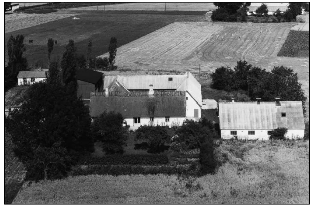
Løndal - Luffoto 1964