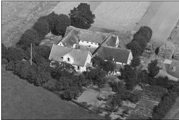
Lønborg - Luffoto 1937

Luffotos fra 'Danmark set fra Luften' (Det Kongelige Bibliotek):