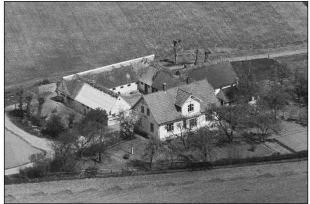
Lønborg - Luffoto 1949