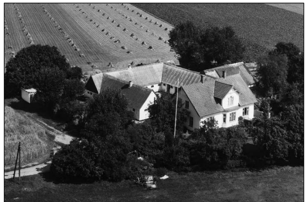
Lønborg - Luffoto 1964