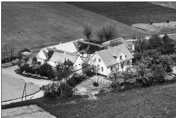
Lønborg - Luffoto 1955