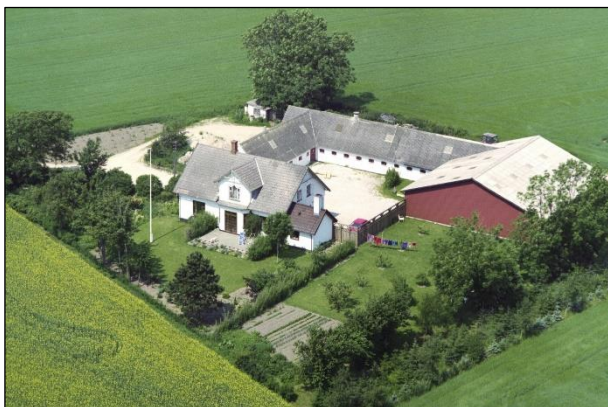
Lønborg - Luffoto 1987