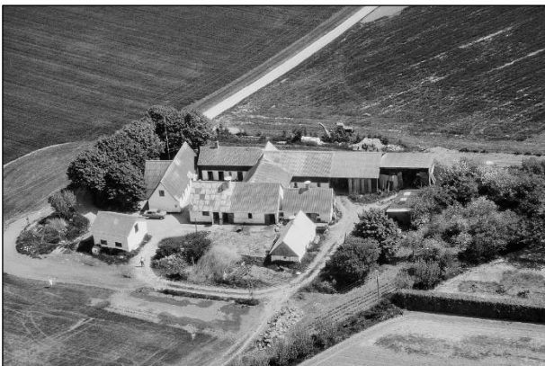
Eskelund - Luffoto 1979