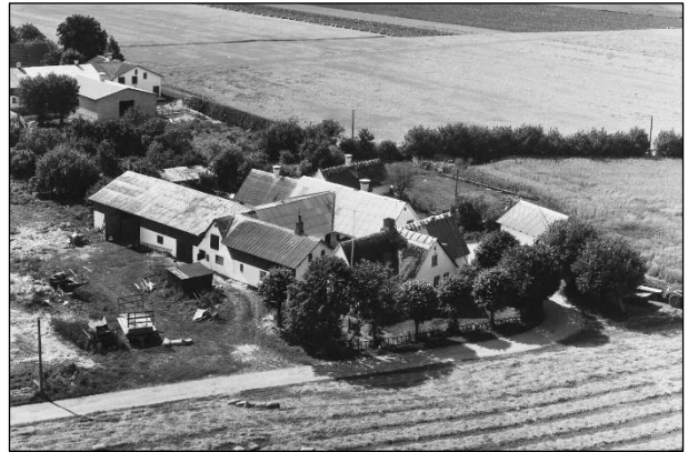
Eskelund - Luffoto 1964 (Løderupgaard i Baggrunden)