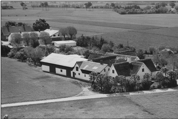
Eskelund - Luffoto 1954 (Løderupgaard i baggrunden)