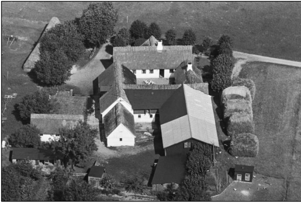
Eskelund - Luffoto 1937

Luffotos fra 'Danmark set fra Luften' (Det Kongelige Bibliotek):