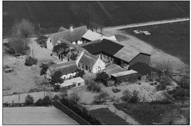
Eskelund - Luffoto 1949