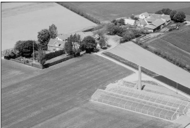
Hollændergaard og Eskelund - Luftfoto 1979