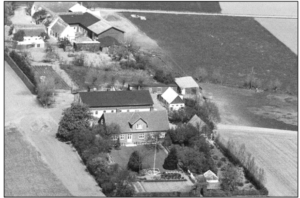
Løderupgaard - Luftfoto 1949 (med Eskelund i baggrunden)