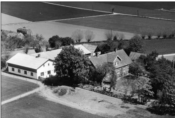
Løderupgaard - Luftfoto 1955