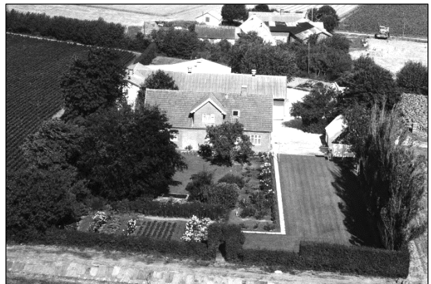
Hollændergaard - Luftfoto 1964