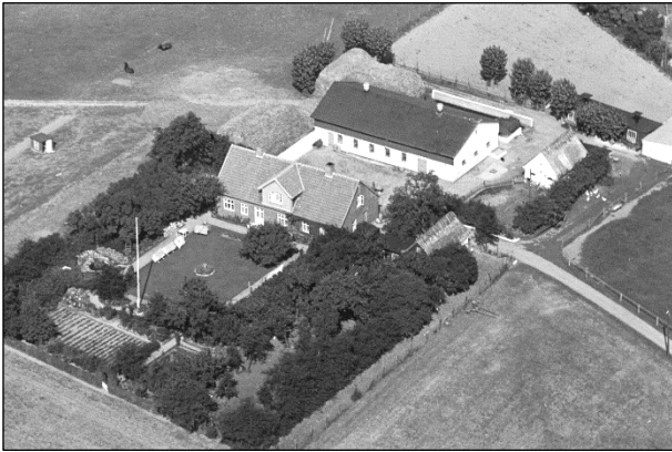
Løderupgaard - Luftfoto 1937

Luftfotos fra 'Danmark set fra Luften' (Det Kongelige Bibliotek):