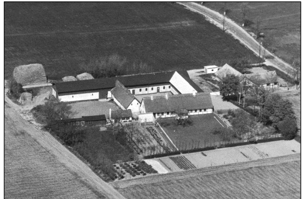
Fuglebækgaard - Luftfoto 1949