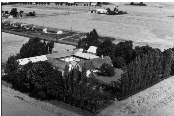
Fuglebækgaard - Luftfoto 1964