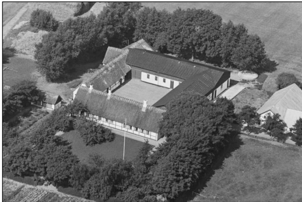
Fuglebækgaard - Luftfoto 1937

Luffotos fra 'Danmark set fra Luften' (Det Kongelige Bibliotek):