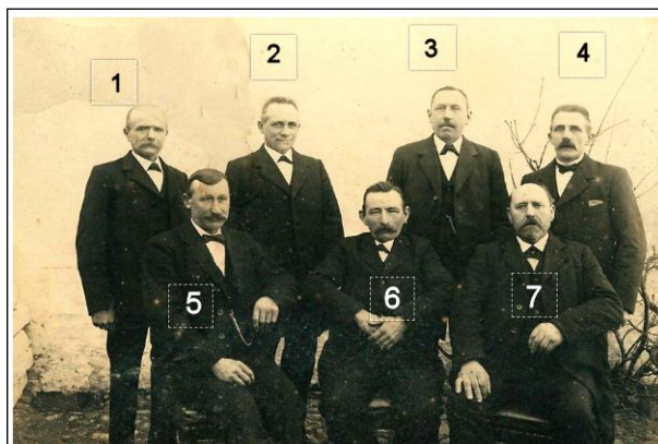
Strøby Sogneråd 1913-1917