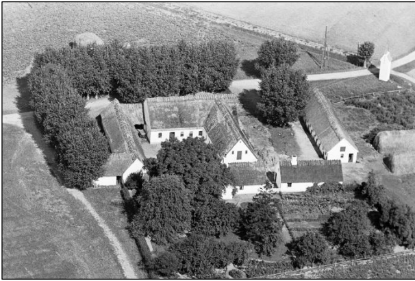
Lodbjerggaard - Luffoto 1937

Luffotos fra 'Danmark set fra Luften' (Det Kongelige Bibliotek):