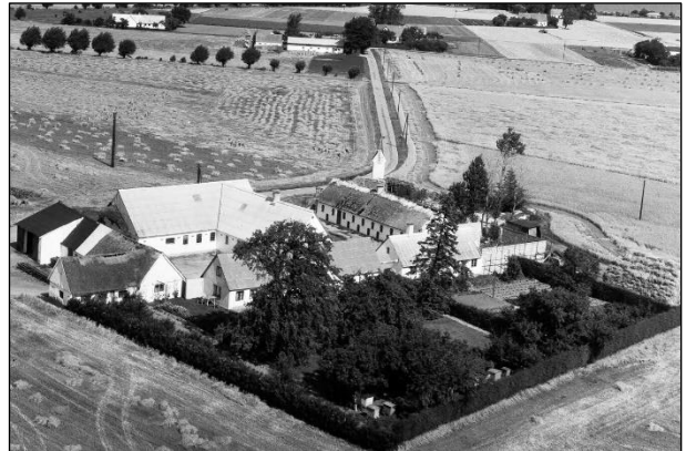
Lodbjerggaard - Luffoto 1964