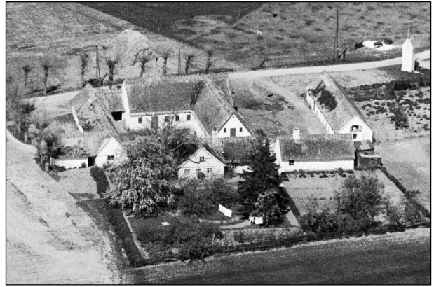
Lodbjerggaard - Luffoto 1949