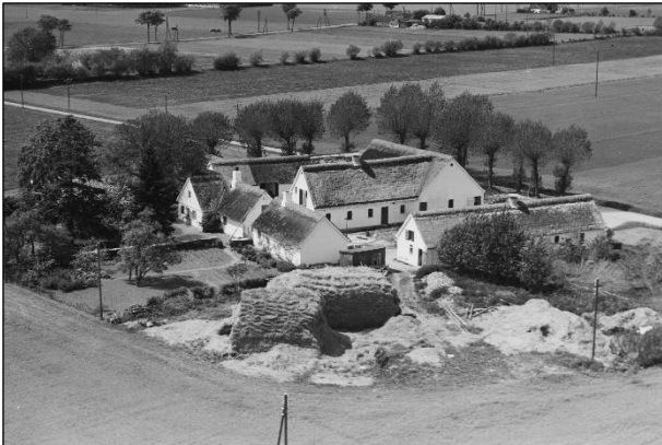
Lodbjerggaard - Luffoto 1954