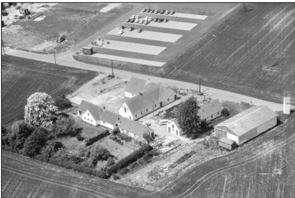
Lodbjerggaard - Luffoto 1979