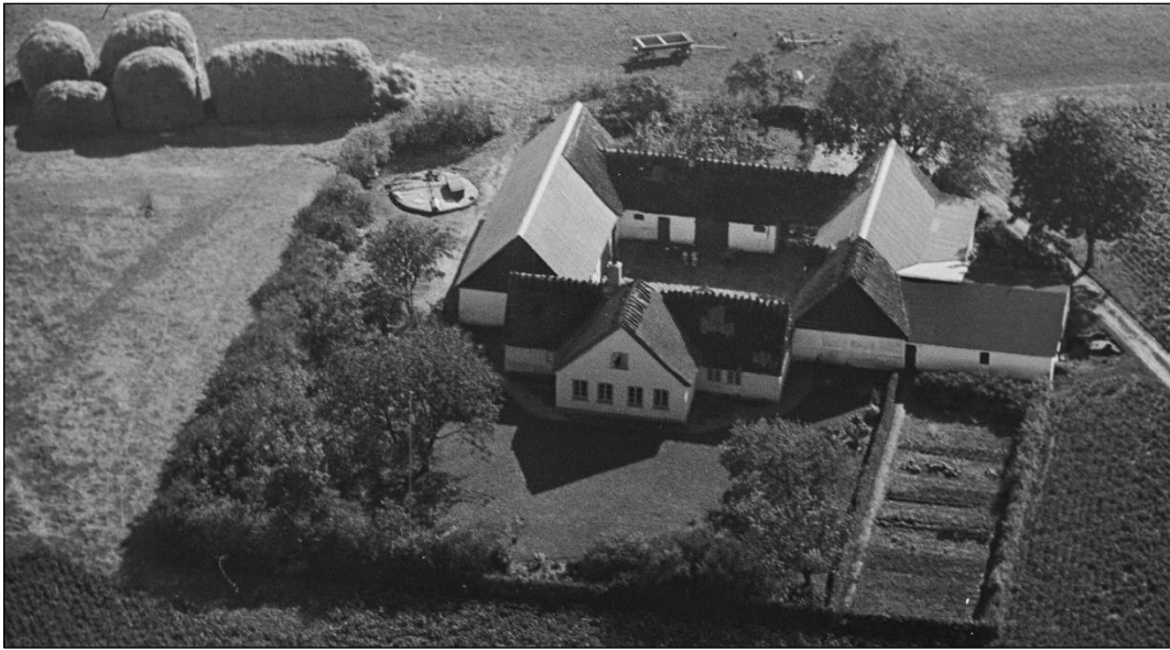
Nielstrupvej 64 - 1949