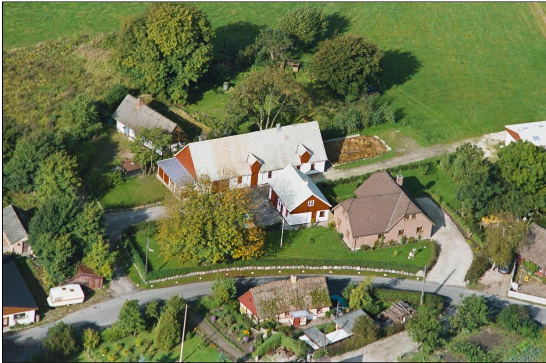
Nielstrupvej 63 - 1991