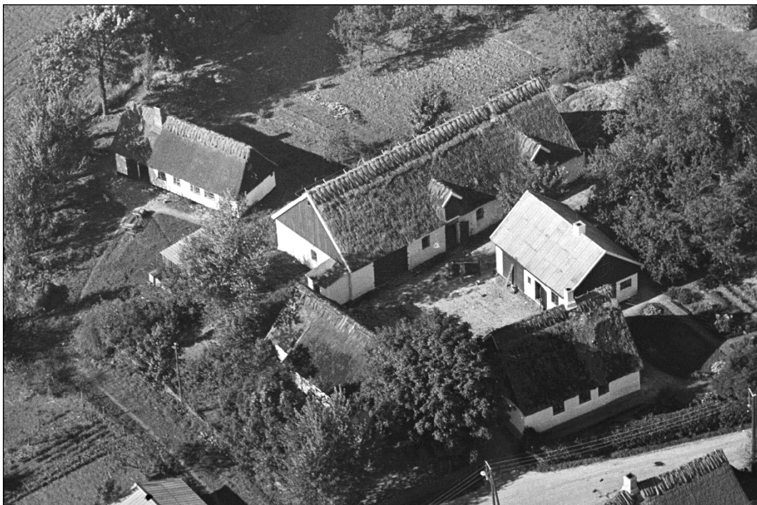
Nielstrupvej 63 - 1949

Luffotos fra 'Danmark set fra Luften' (Det Kongelige Bibliotek):