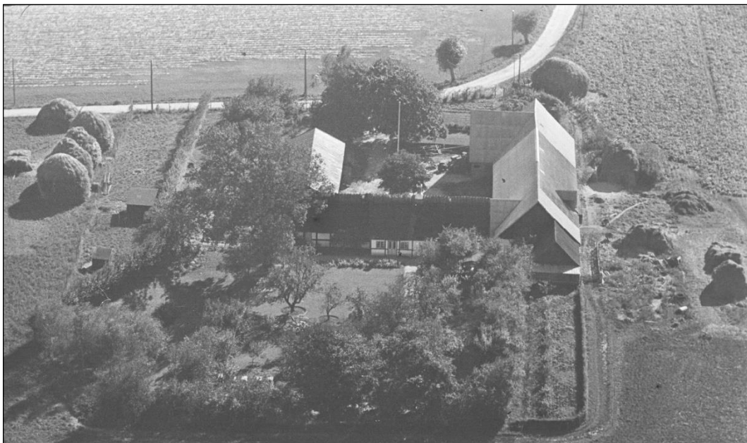
Bakkegaard - Tårnhusvej 8 - Luffoto 1949

Luffotos fra ' Danmark set fra Luften ' (Det Kongelige Bibliotek):