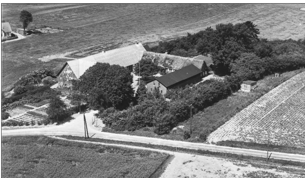
Bakkegaard - Tårnhusvej 8 - Luffoto 1955