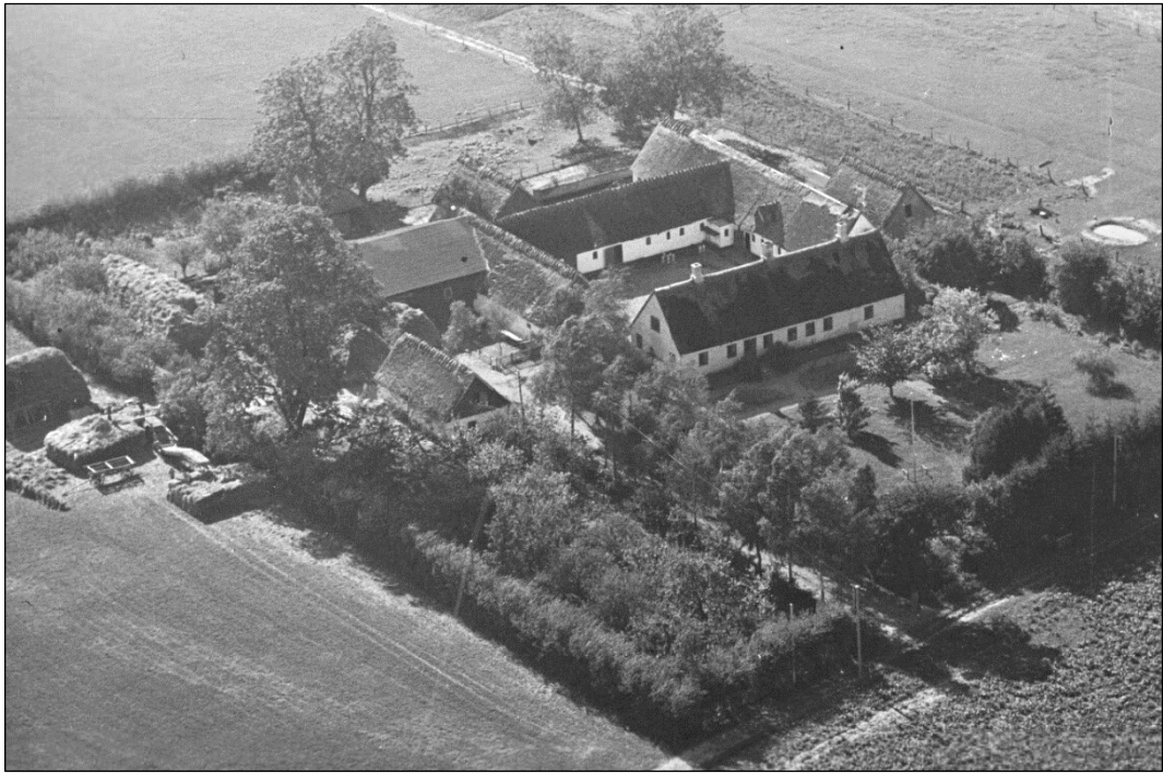
Slettehavegaard - Slettehavevej 63 - 1949