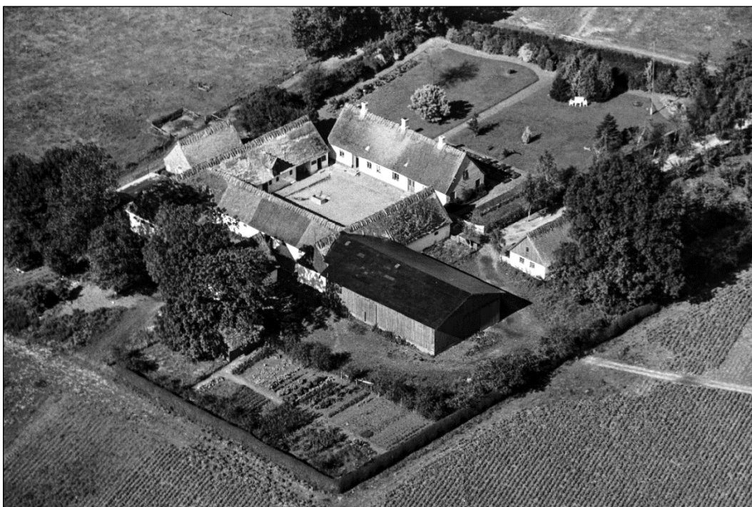
Slettehavegaard - Slettehavevej 63 - 1939

Luffotos fra 'Danmark set fra Luften' (Det Kongelige Bibliotek):