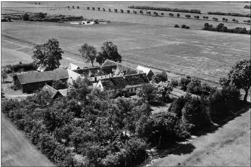
Slettehavegaard - Slettehavevej 63 - 1955