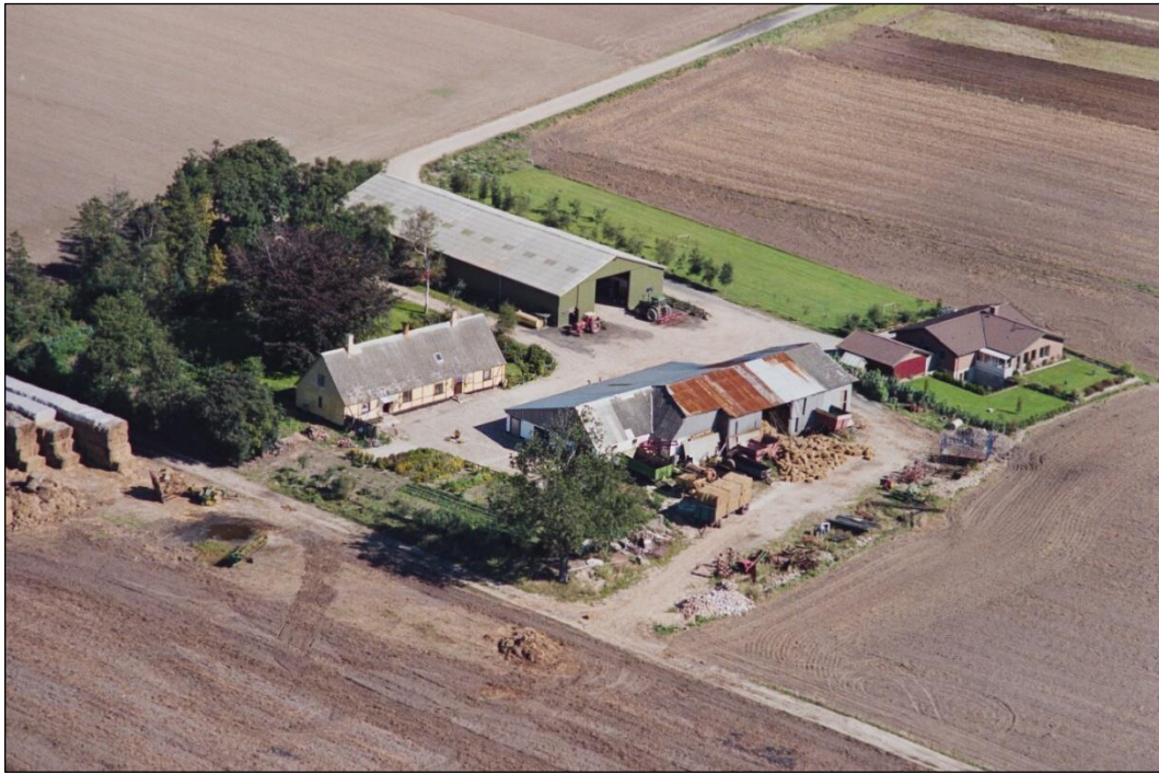
Slettehavegaard - Slettehavevej 63 - 1990