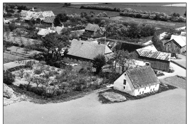
Højlandsgaard - Luffoto 1955