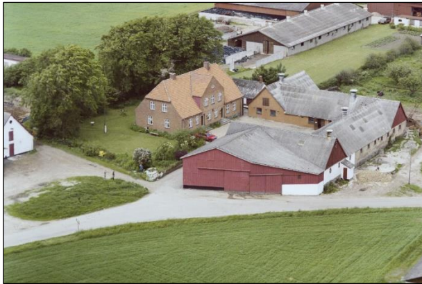
Højlandsgaard - Luffoto 1987