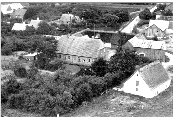
Højlandsgaard - Luffoto 1951