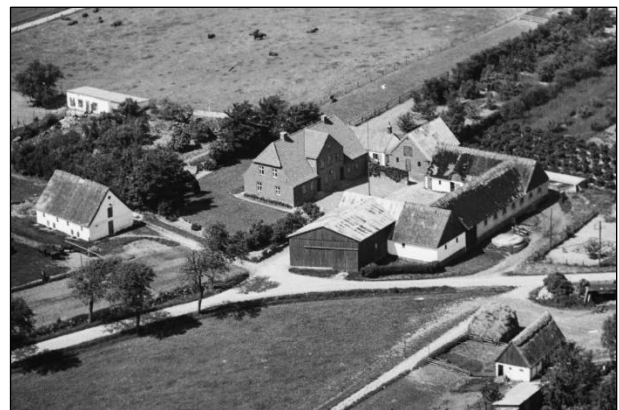
Højlandsgaard - Luffoto 1949