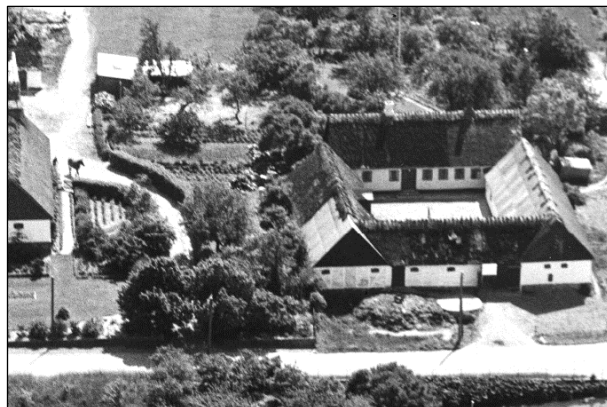
Kærsgaard - Luffoto 1949