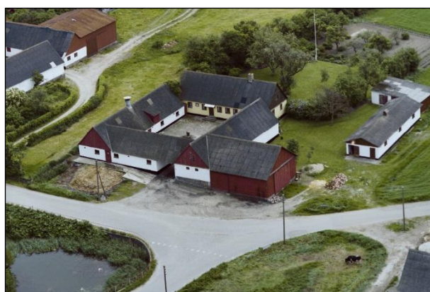
Kærsgaard - Luffoto 1987