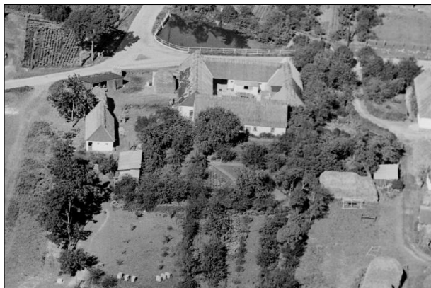
Kærsgaard - Luffoto 1939

Luffotos fra ' Danmark set fra Luften ' (Det Kongelige Bibliotek):