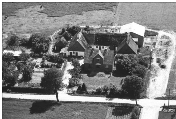
Kildegaard - Luffoto 1949