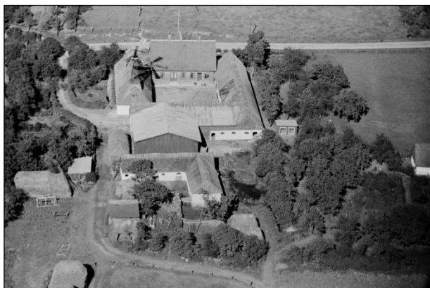
Kildegaard - Luffoto 1939

Luffotos fra 'Danmark set fra Luften' (Det Kongelige Bibliotek):