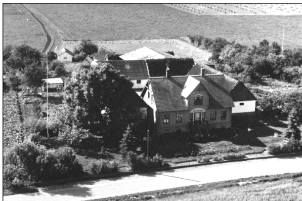
Kildegaard - Luffoto 1961