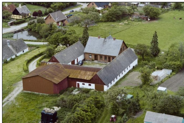
Kildegaard - Luffoto 1987