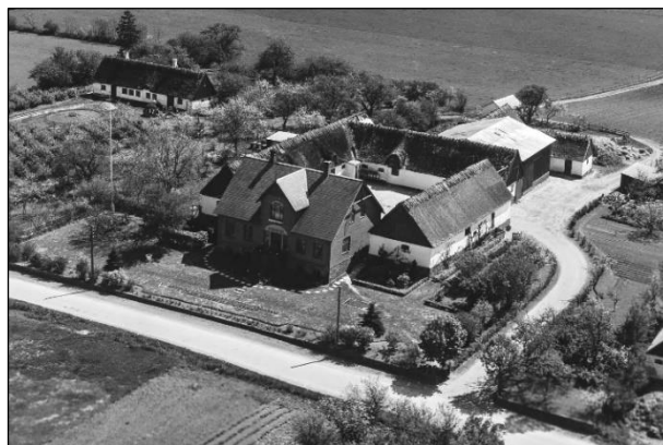
Kildegaard - Luffoto 1955