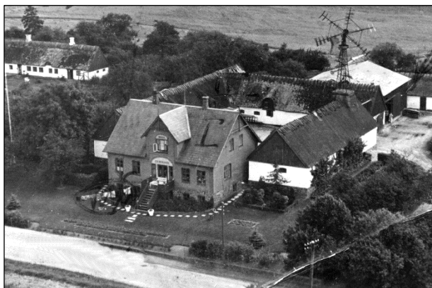
Kildegaard - Luffoto 1951