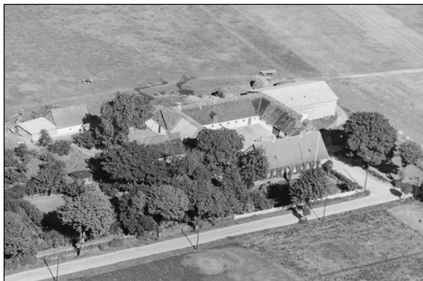
Højsteensgaard - Luftfoto 1939

Luffotos fra ' Danmark set fra Luften ' (Det Kongelige Bibliotek):