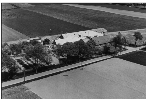
Højsteensgaard - Luftfoto 1955