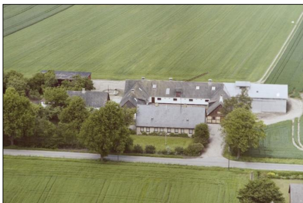
Højsteensgaard - Luftfoto 1987