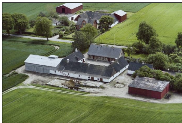
Højsteensgaard - Luftfoto 1987