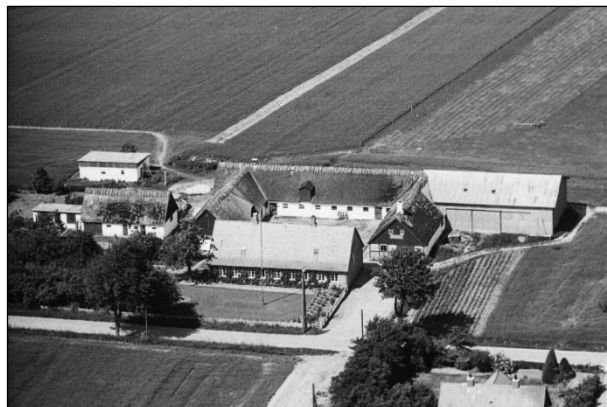
Højsteensgaard - Luftfoto 1949