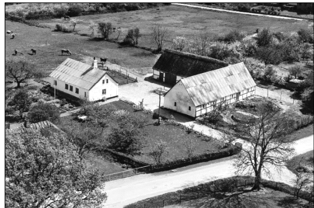
Toftebjerggaard - 1955