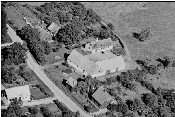
Toftebjerggaard - 1939

Luffotos fra 'Danmark set fra Luften' (Det Kongelige Bibliotek):