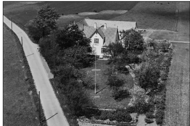
Nordhøj - 1955