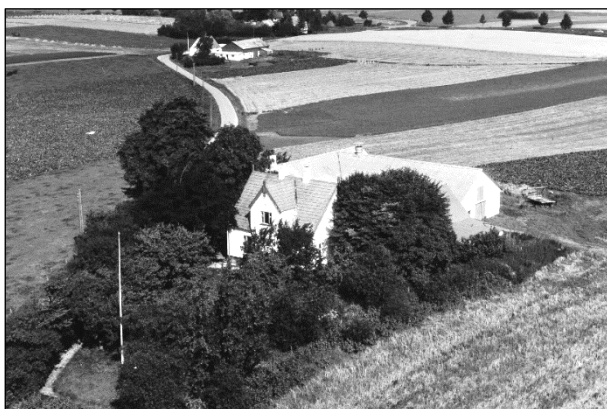
Nordhøj - 1961