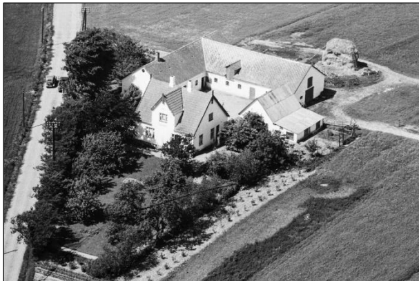
Nordhøj - 1949

Luffotos fra ' Danmark set fra Luften ' (Det Kongelige Bibliotek):