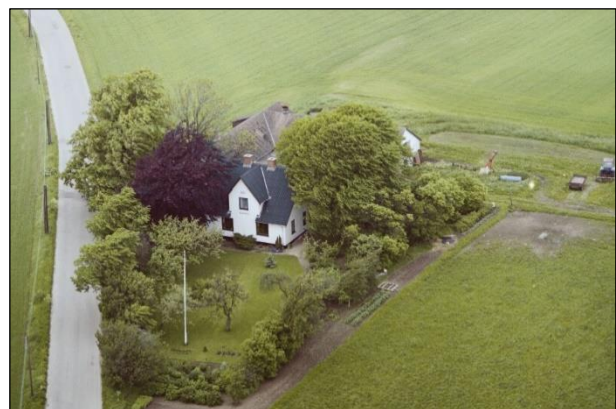
Nordhøj - 1987